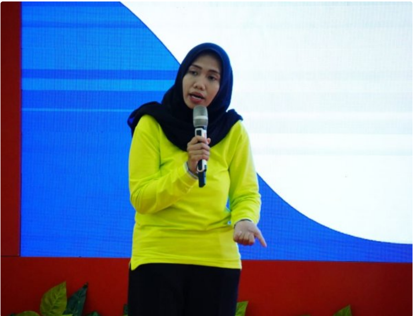
DWP Kemenkumham Jateng sampaikan Cegah Diabetes Melitus

CILACAP - Mengisi kegiatan Pertemuan Dharma Wanita Persatuan (DWP)